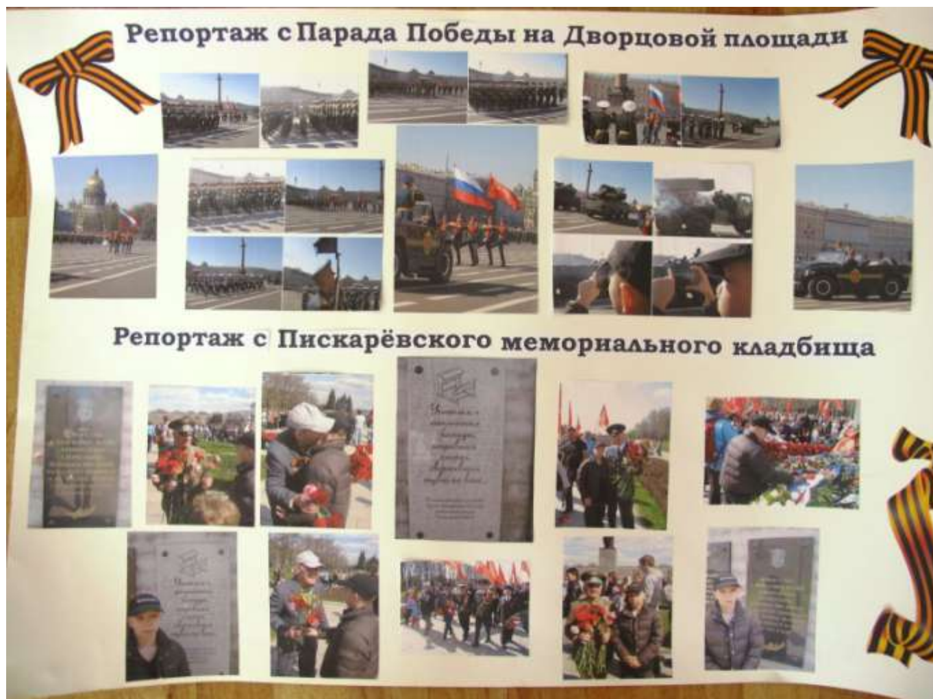
Репортаж Михаила Новикова, 8 класс

Мы гордимся тем, что Ленинград одним из первых был назван городом-героем. Мы сердечно благодарим ветеранов, воинов-фронтовиков, блокадников, тружеников тыла, которые подарили нам жизнь и свободу. Безмерное вам спасибо за то, что сохранили наш прекрасный город, в котором нам выпало счастье сегодня жить и трудиться", - говорится в послании властей Петербурга.