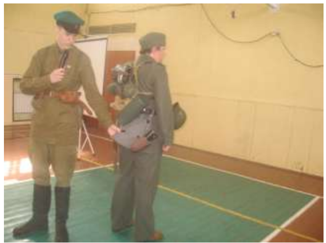
Ученики лицея № 470 с нашим гостем - членом ВИК, занимающимся реконструкцией морской пехоты СССР времен Великой Отечественной войны 1941 – 1945 г.г., форма образца 1943г.